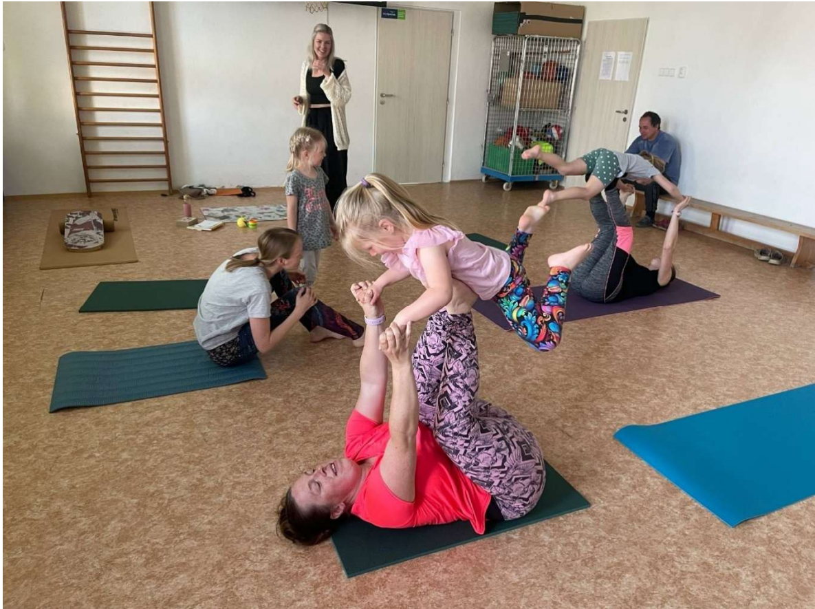
Jóga s odborníkem