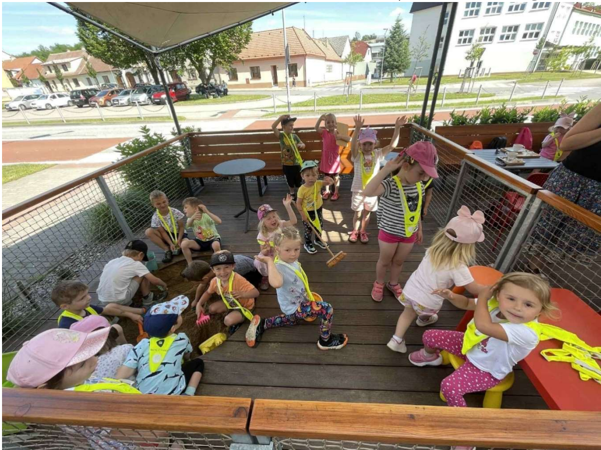
Výlet do Vladislavi