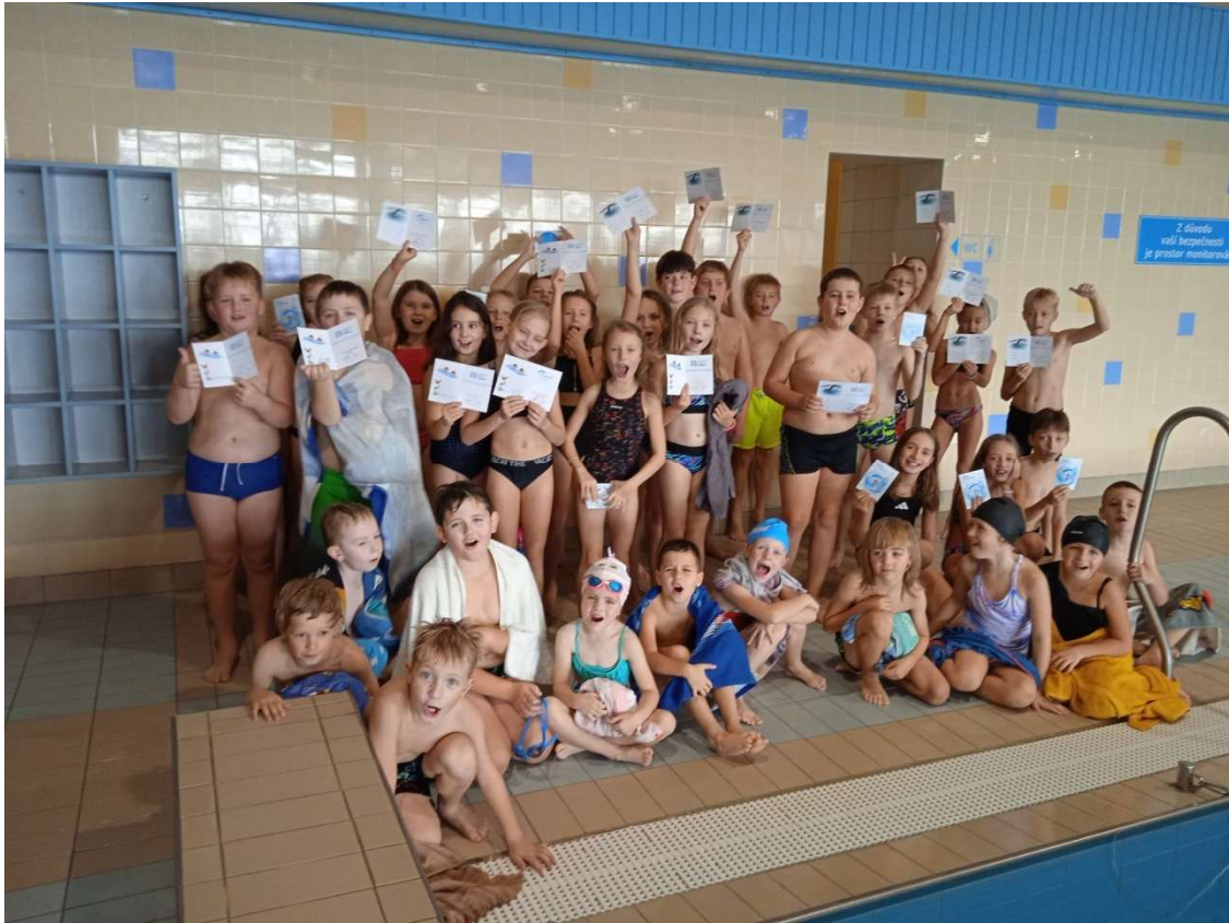
Plavání podzim 2024 (od září 2024)