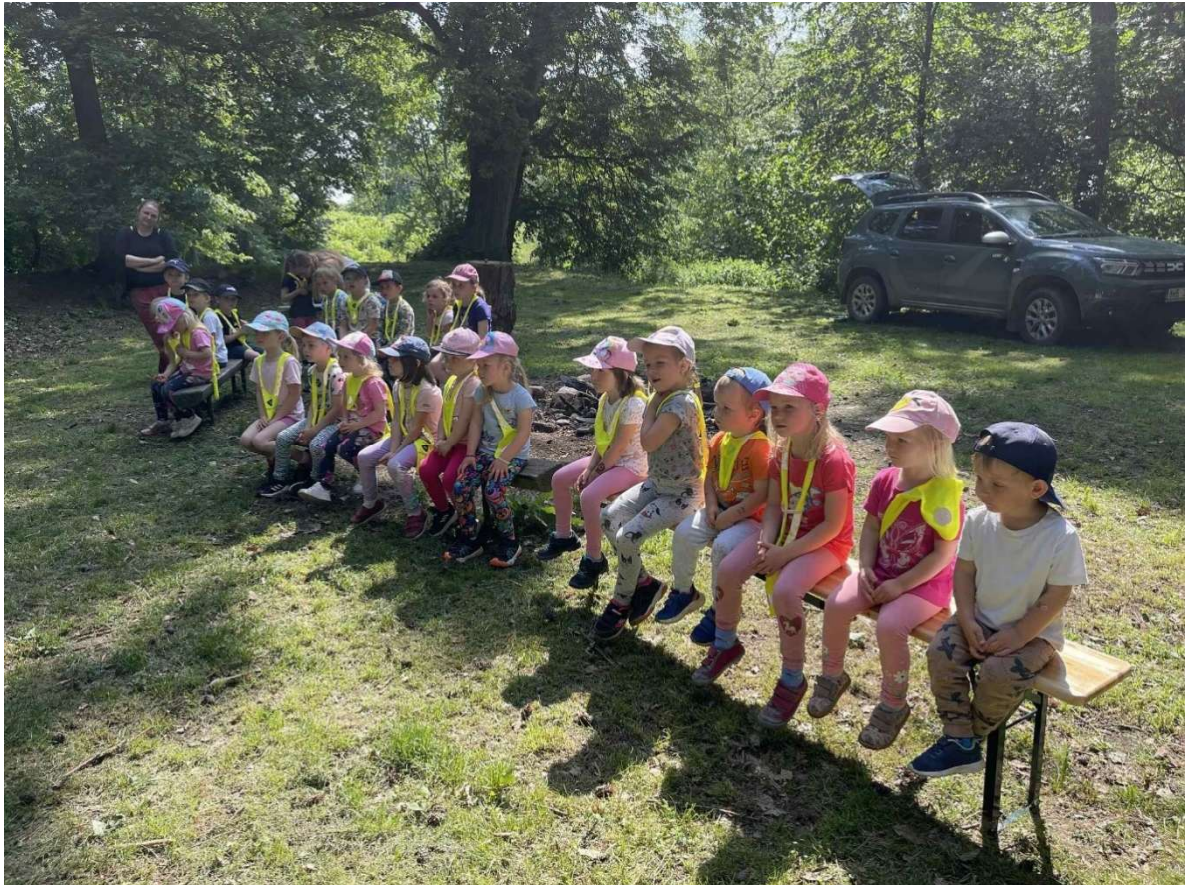
Den s myslivci