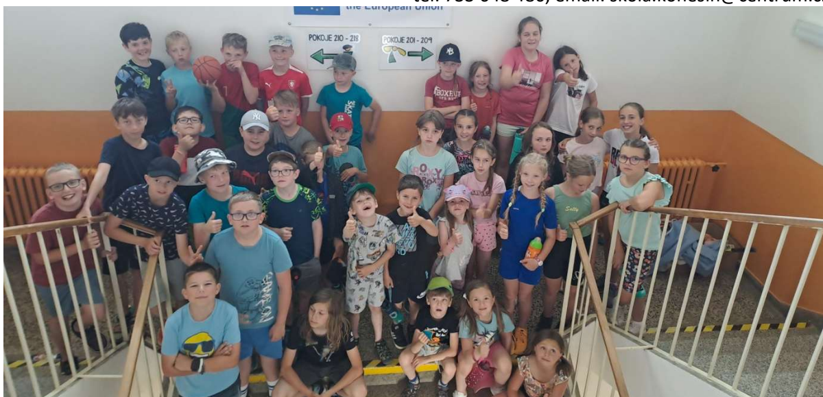
Školní výlet – Ivančice

tel: 733 648 480, email: skola.konesin@centrum.cz