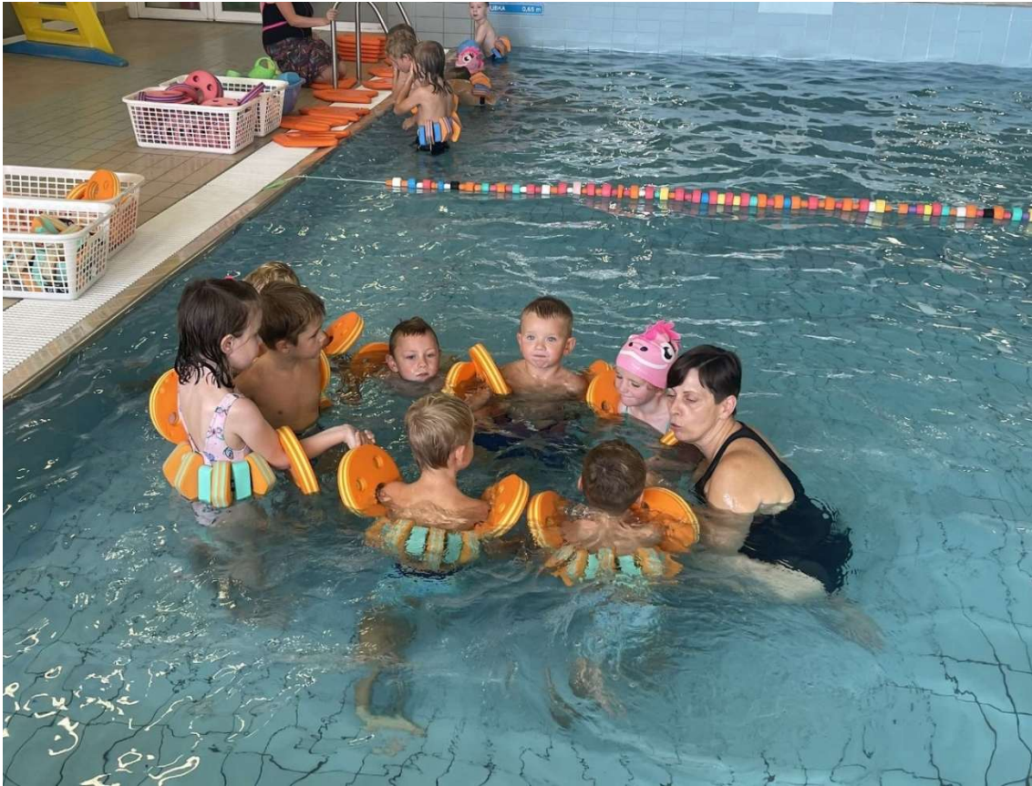
Plavání – Laguna Třebíč