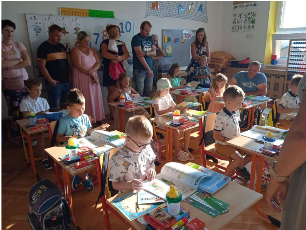
První školní den