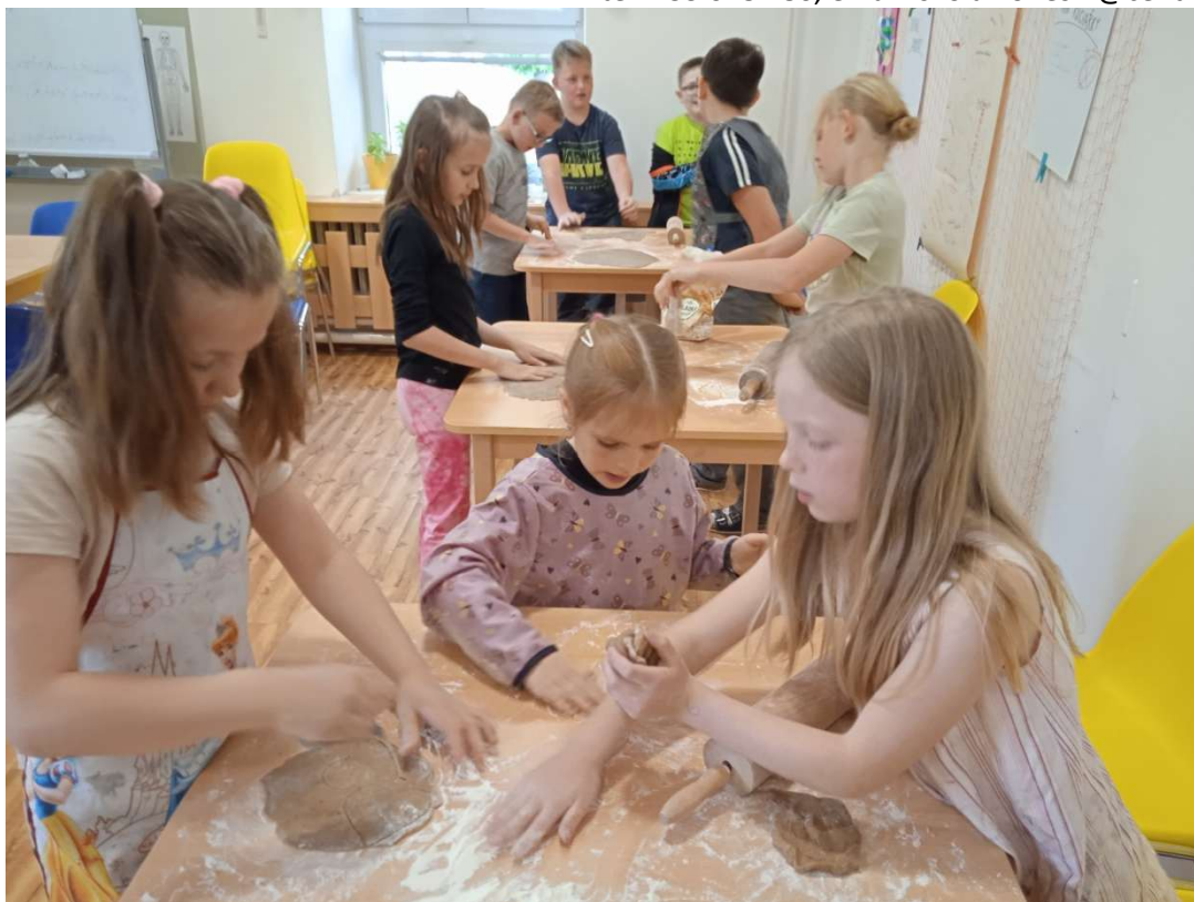
Družina v květnu