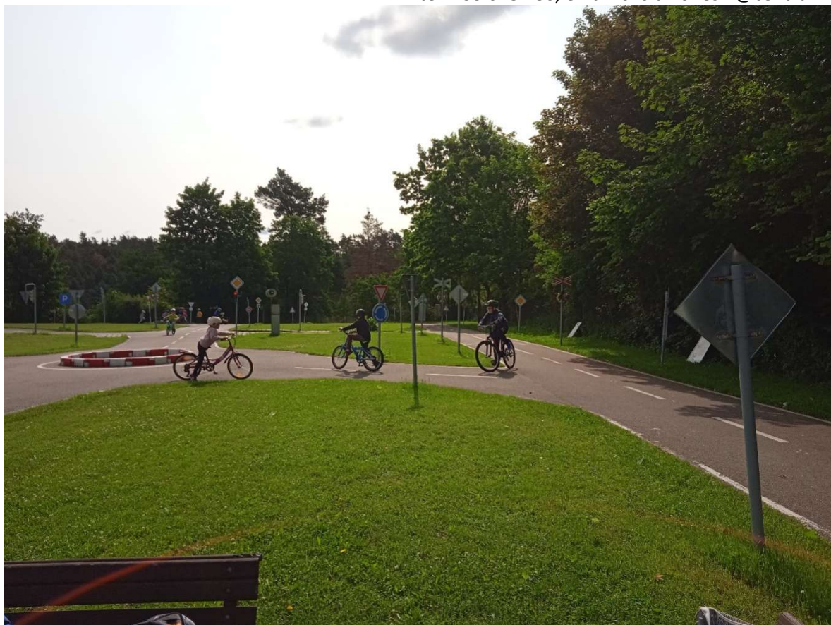
Dopravní hřiště Třebíč