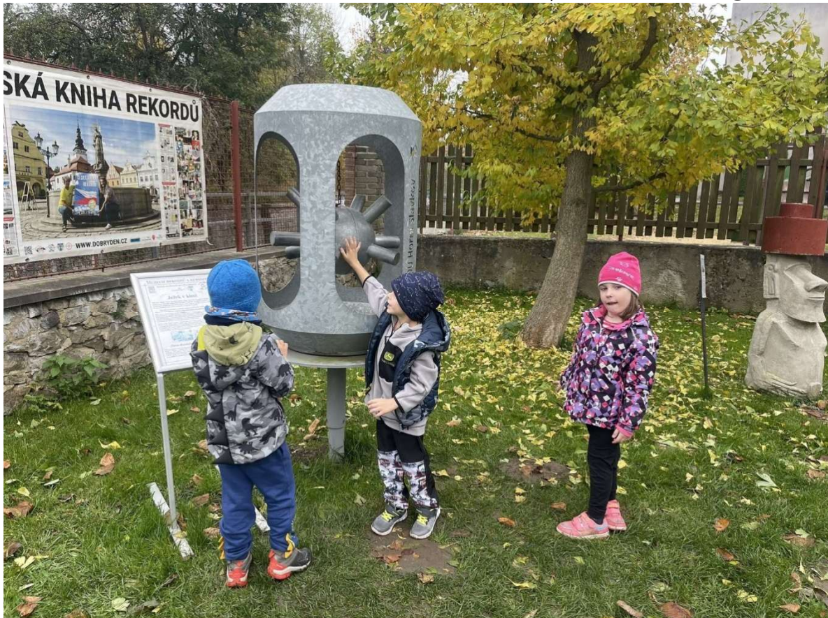
Muzeum rekordů a kuriozit – Pelhřimov