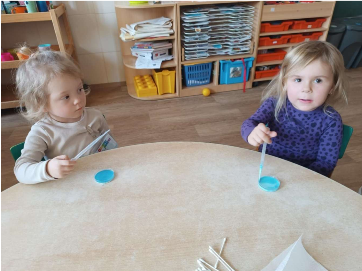
Chemie v kuchyni