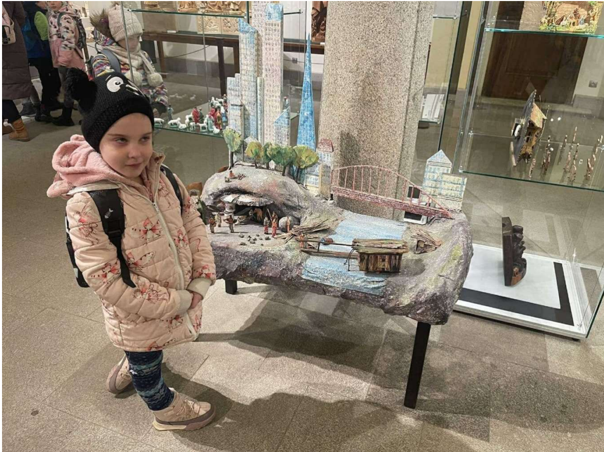
Muzeum Vysočiny Třebíč – výstava betlémů