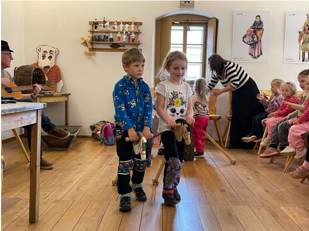
Centrum tradiční lidové kultury – Třebíč