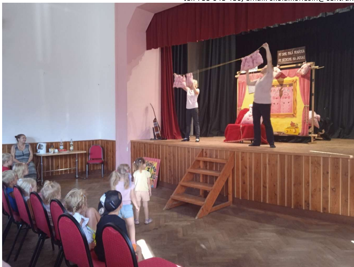
Divadelní představení – Prasečí slečinky 5.9.2024