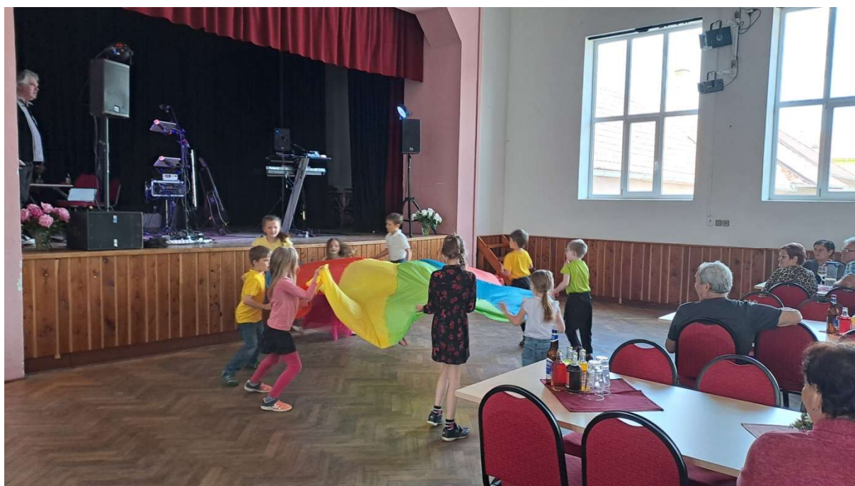
Vystoupení pro seniory