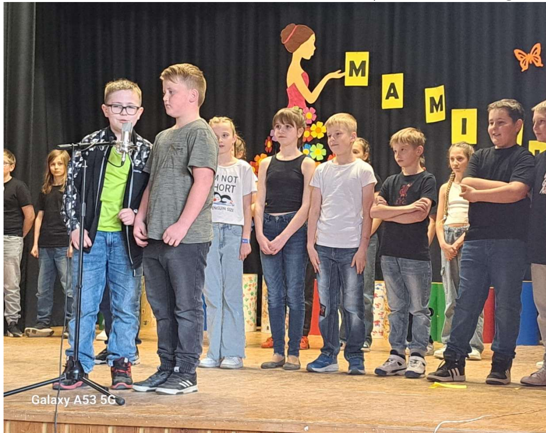
Maminkám – školní akademie