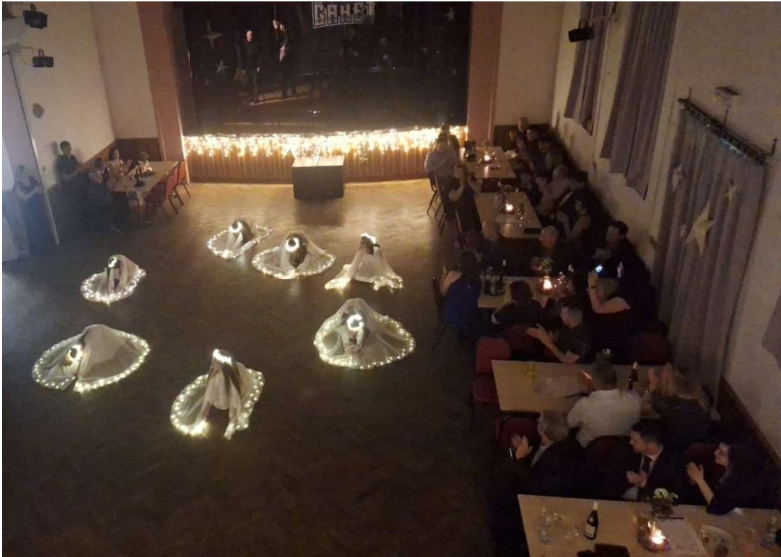
Předtančení na plese