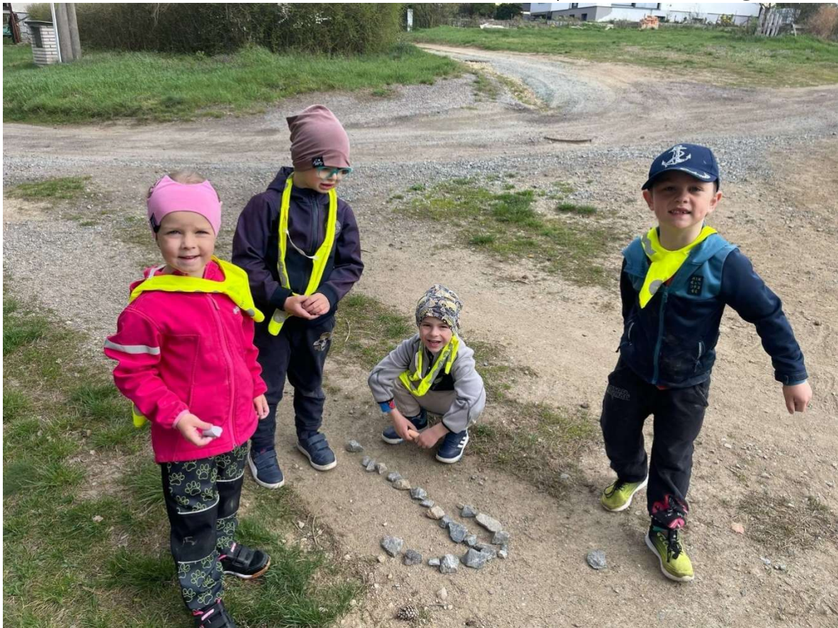
Velikonoční tvoření a cesta