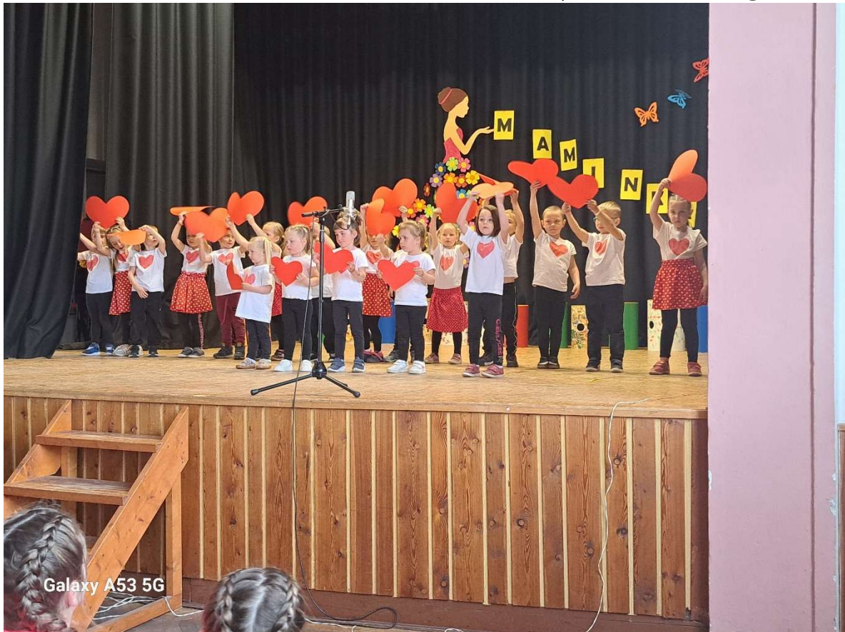
Školní akademie pro maminky