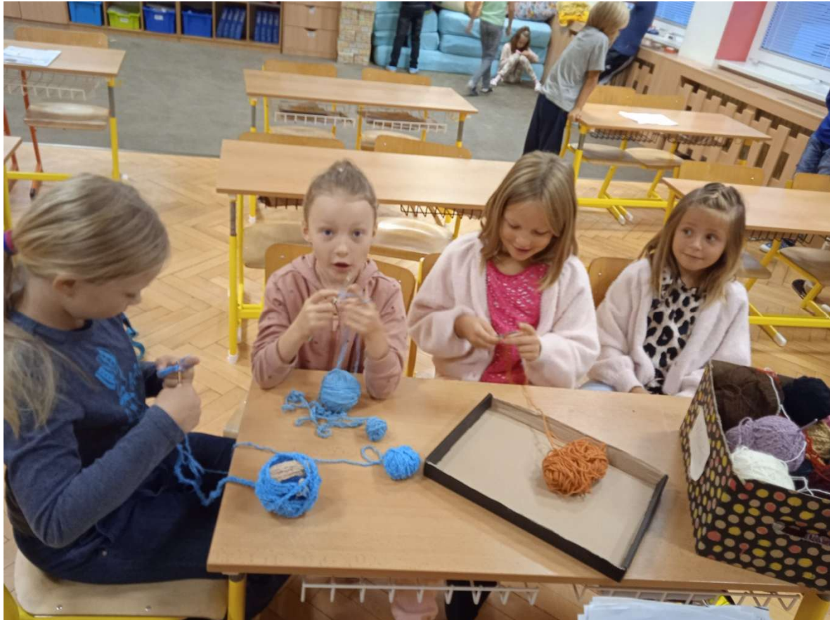
Září v ŠD