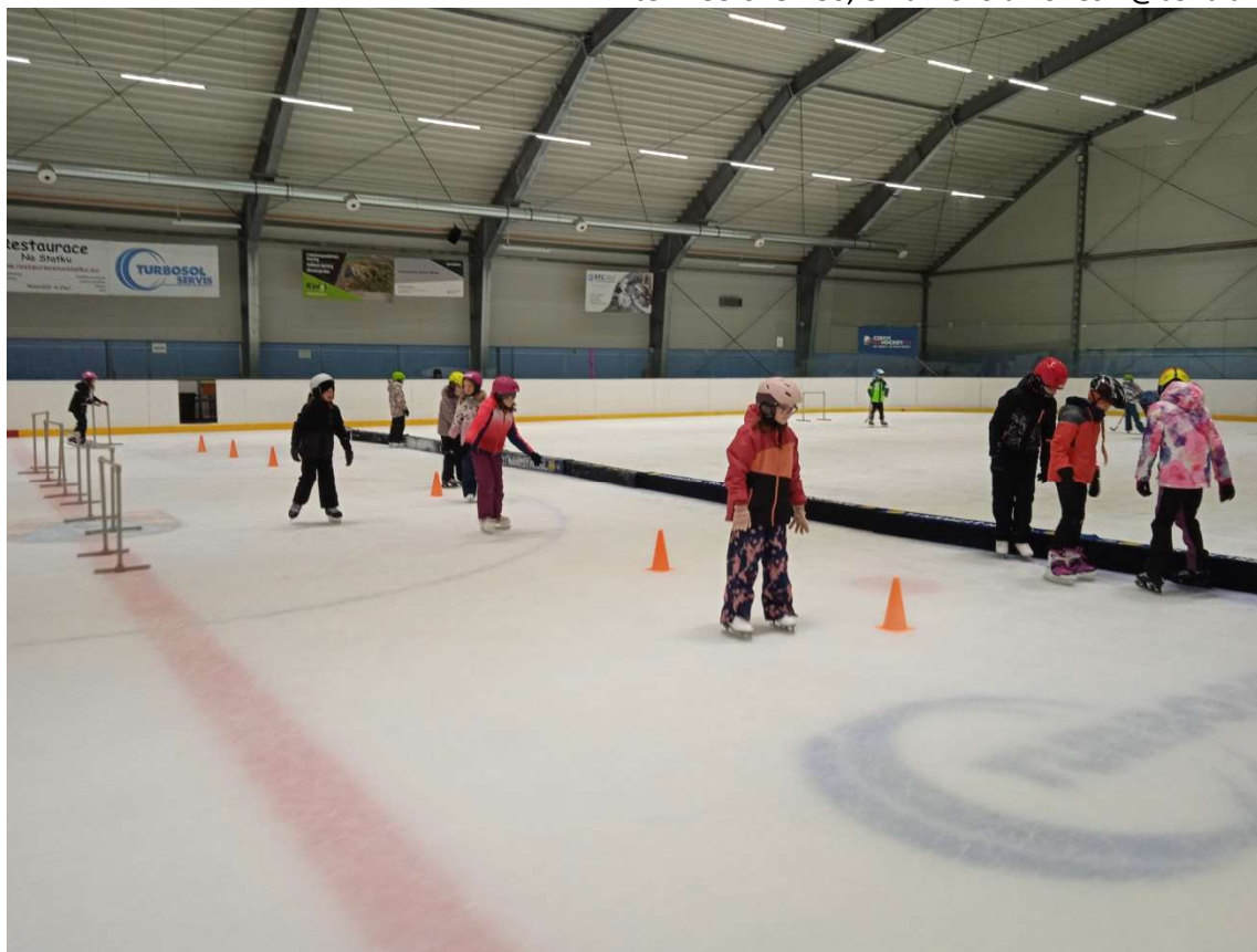
Bruslení v lednu