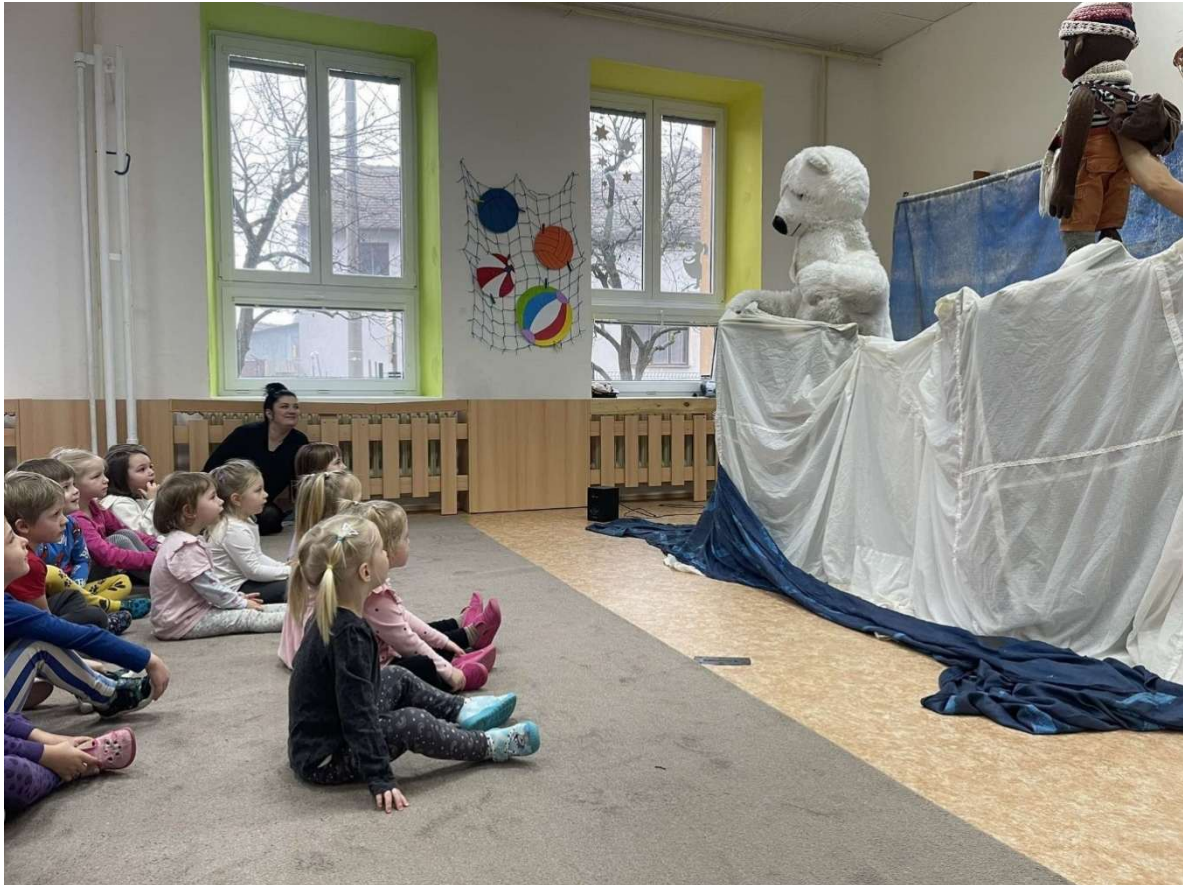
Divadlo – zimní pohádka