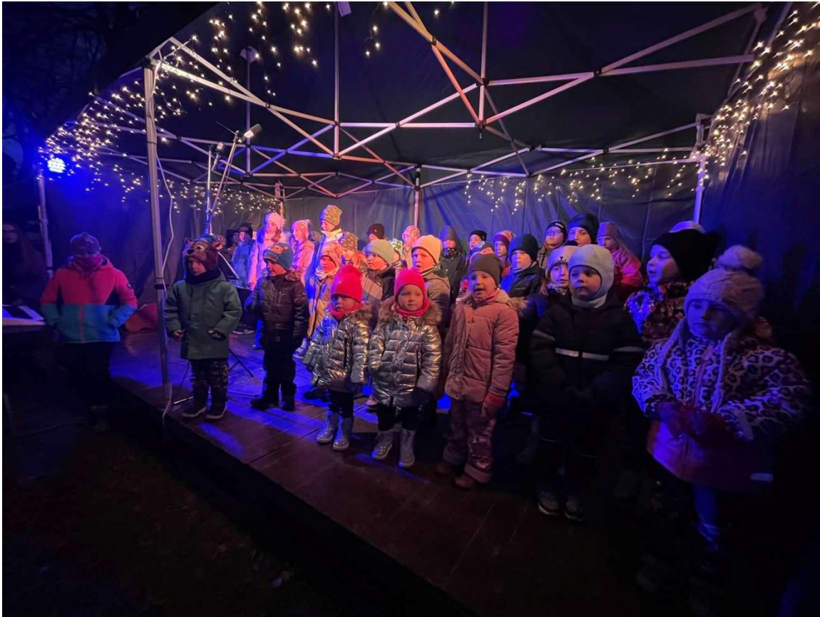
Adventní tvoření a zpívání