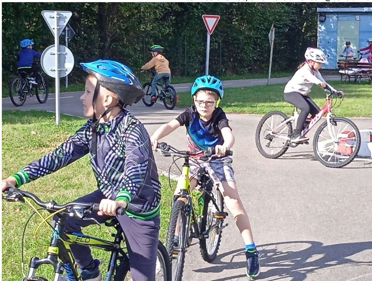
ZŠ Dopravní hřiště