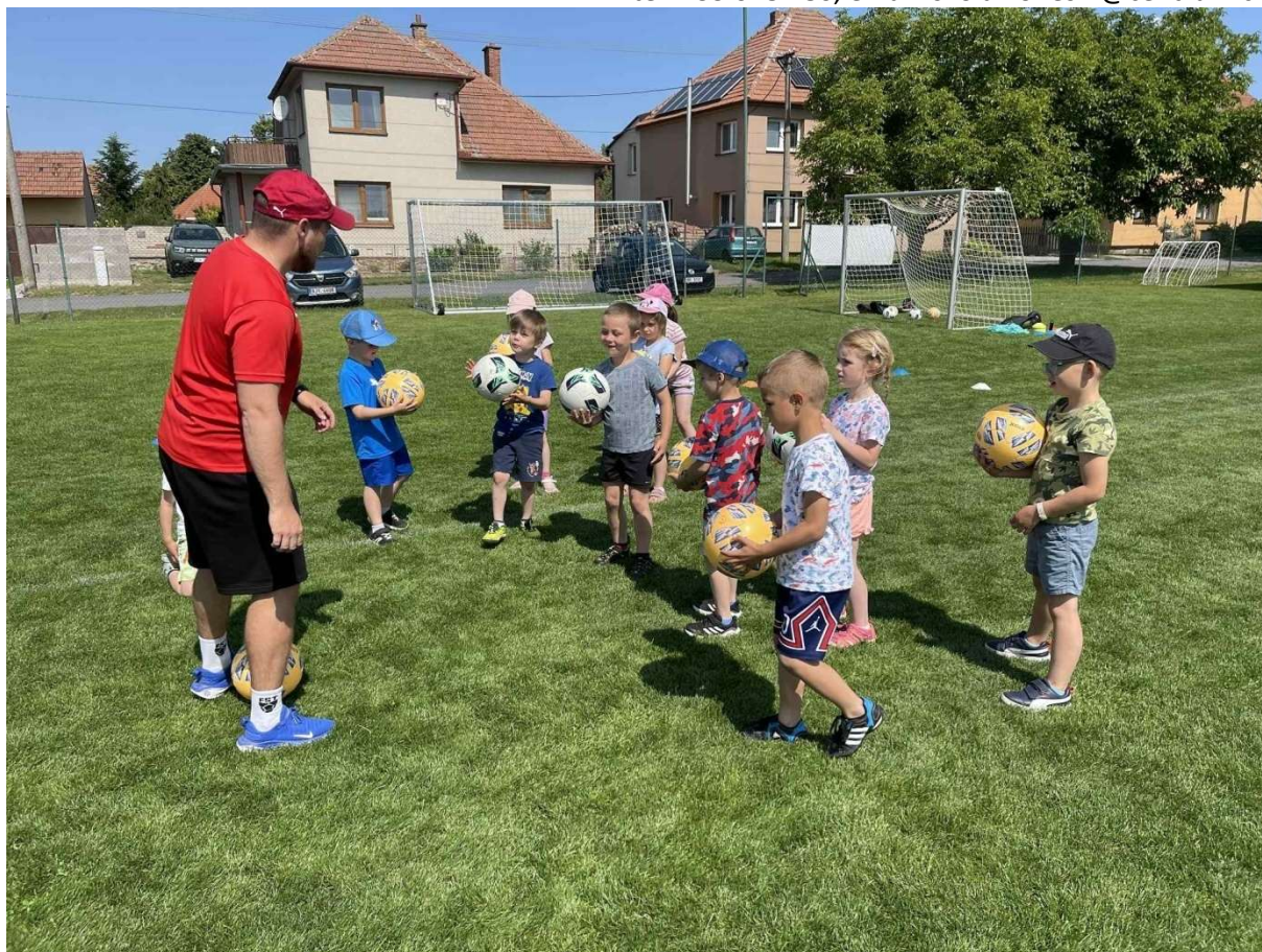
Škola v pohybu