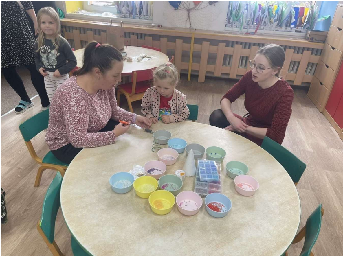
Adventní tvoření a zpívání