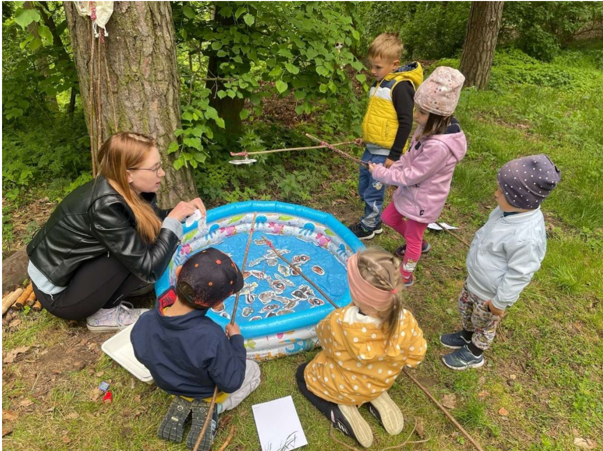
Projektový den o zvířatech